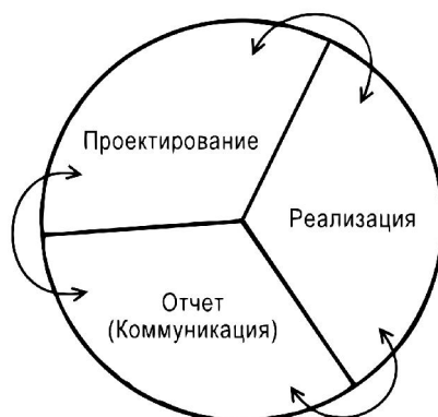
Схема 4. Функциональная структура науки

так или иначе должны быть представлены более широкой аудитории, чем та группа, которая произвела научное исследование.