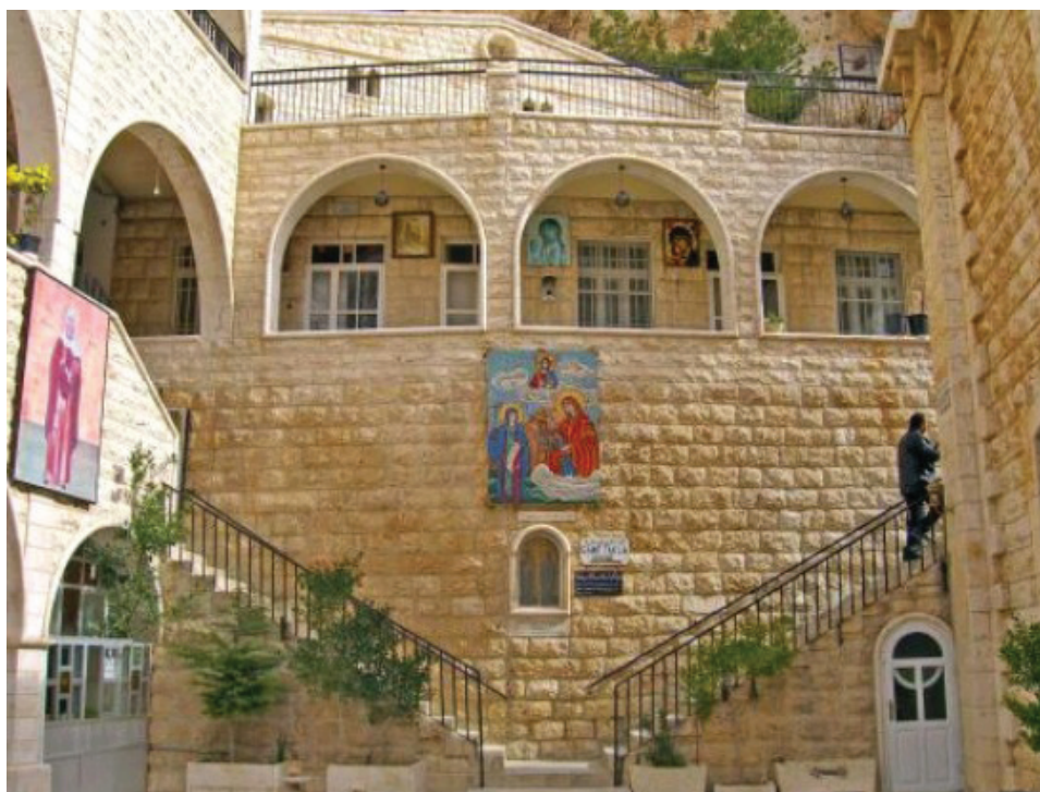
Приложение 7. Патриарший монастырь св. Феклы (фото до 2005 г.). Место, где жила святая.