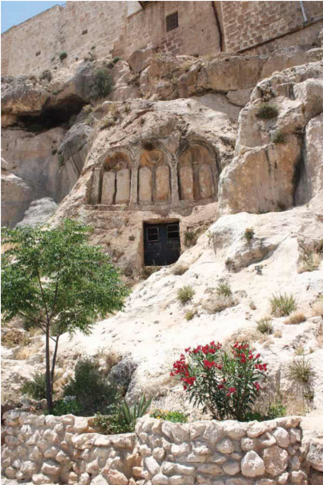
Приложение 1. Монастырь в пещере на горном хребте Каламун